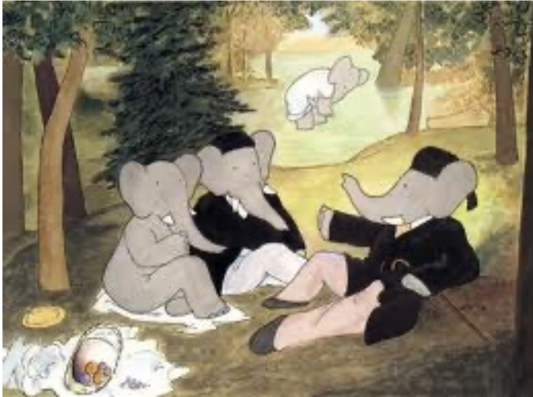
D'après les albums de Babar