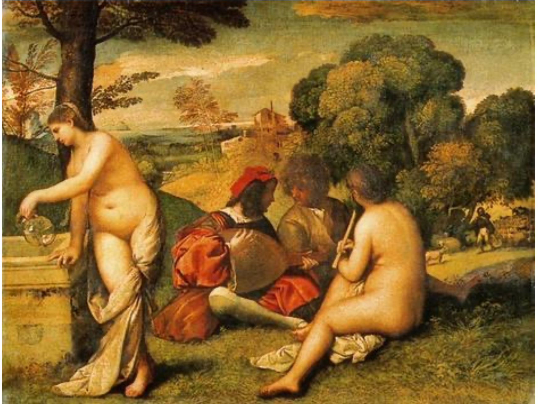
1505-1510 Giorgione « Fête champêtre »