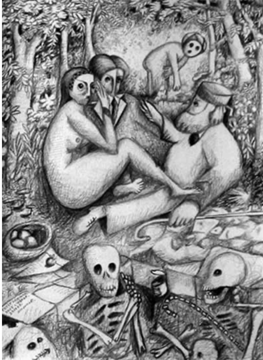
Le déjeuner sous l'herbe