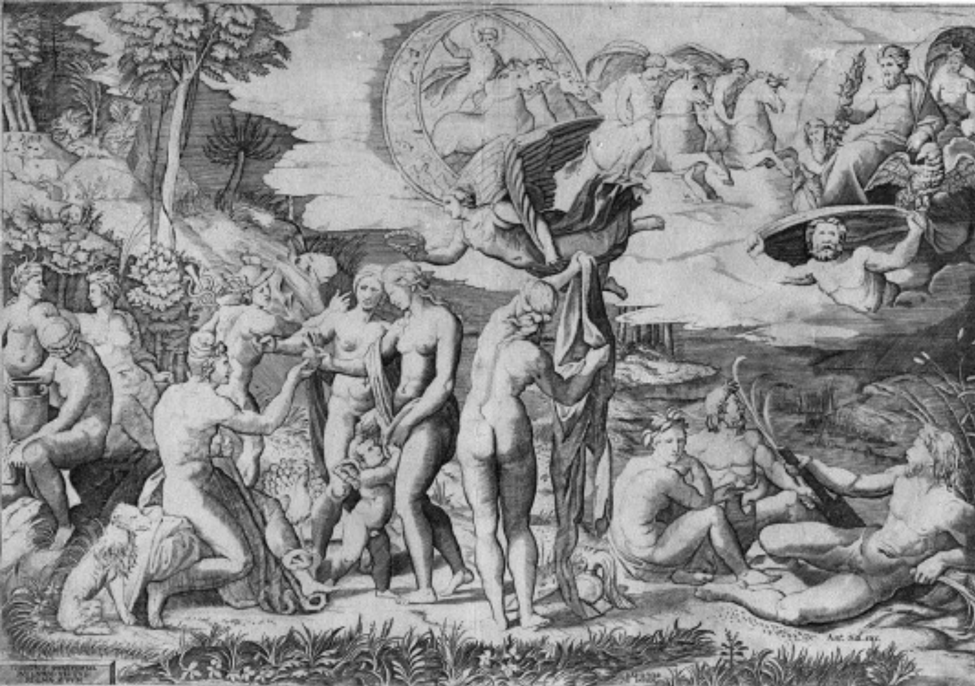
« Le jugement de Pâris » 1525-1530 ; Gravure de Raimondi d'après Raphaël