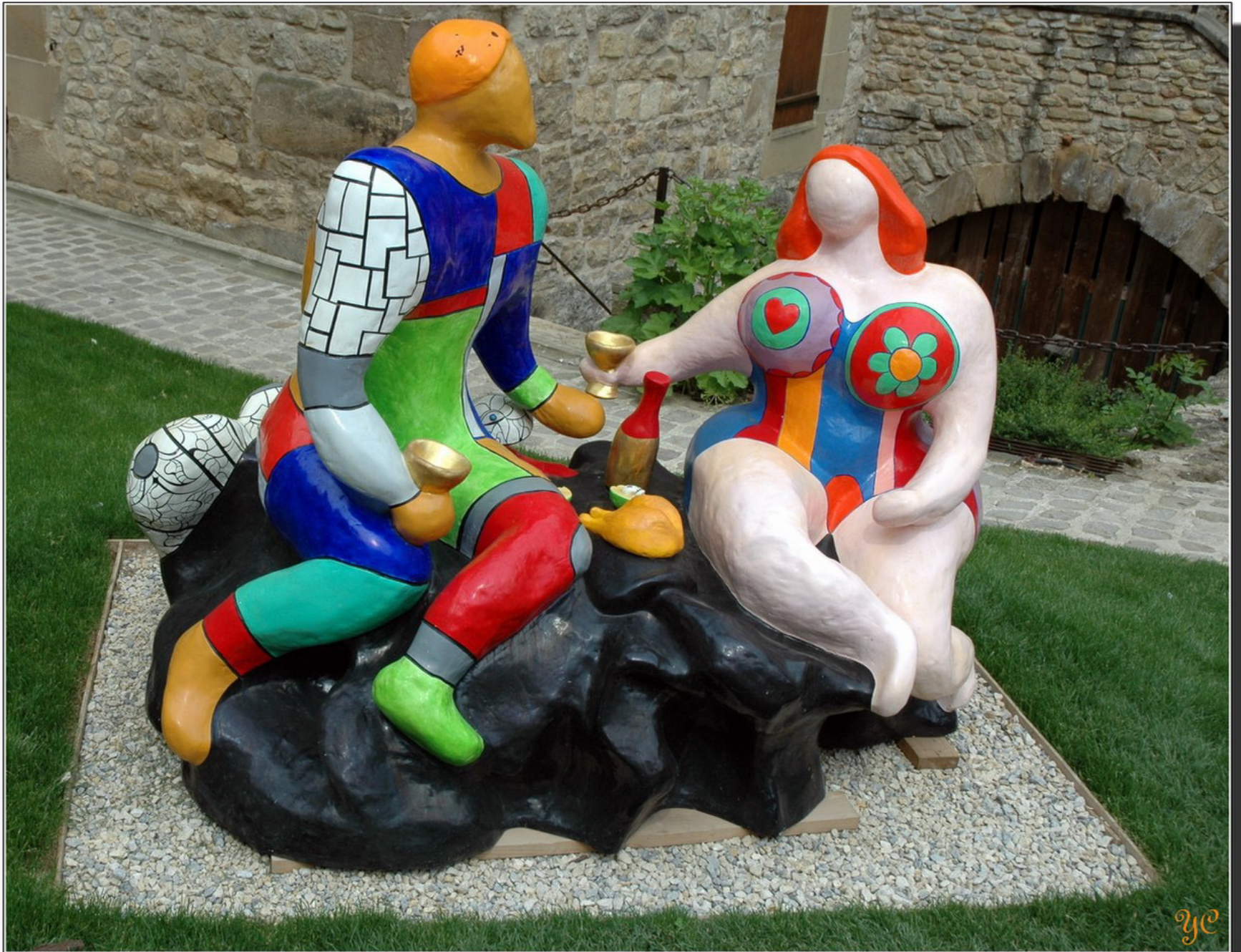
Le déjeuner sur l'herbe