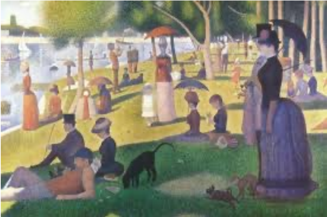
Seurat La grande jatte