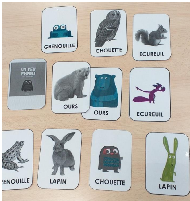
Un peu perdu