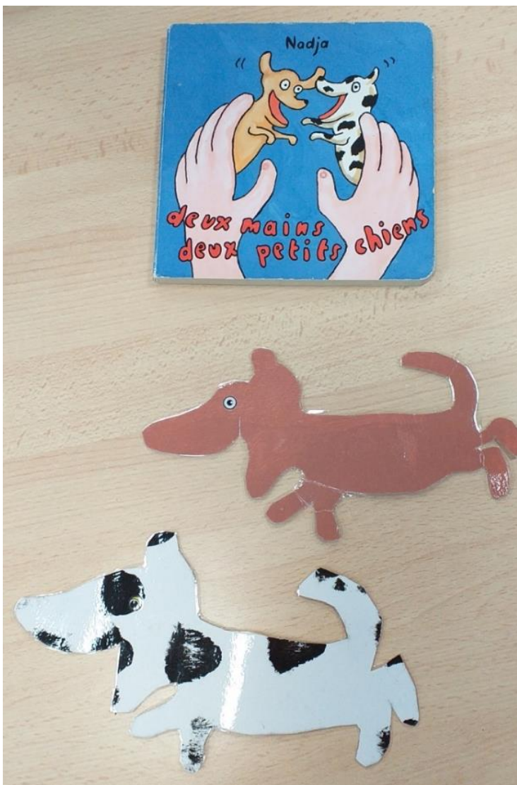
Deux mains deux petits chiens