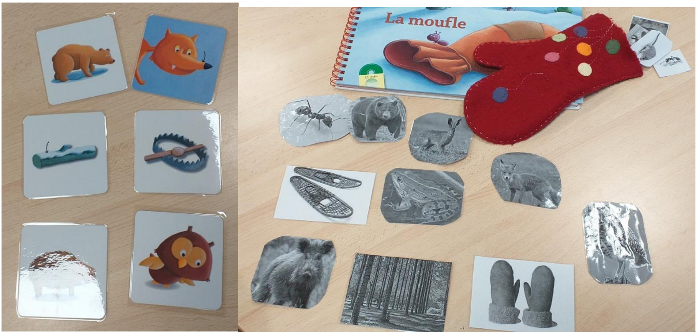
La moufle : Oralbum et son imagier

Voici une boîte à comptines qui reste à la maison sur toute la scolarité de l'école maternelle :