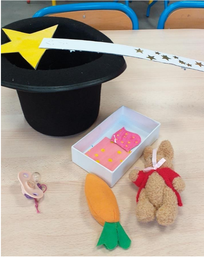
Ti lapin magicien

Le point fort : après avoir entendu, écouté, imité la maitresse, verbaliser, parler et raconter le mieux possible à ses camarades, voici le temps où chaque élève se voit remis tout le matériel papier à peindre afin de se créer sa propre histoire ; chaque histoire est emportée ensuite à la maison et rangé dans sa boîte à histoires. L'enfant ainsi va pouvoir raconter à sa famille l'histoire de tous ces albums au fur et à mesure du déroulement de l'année scolaire.