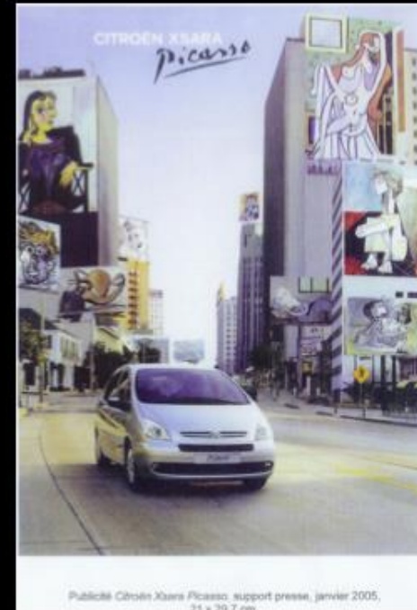
Publicité Citroën Xsara Picasso, support presse, janvier 2005, 11 x 30,7 cm